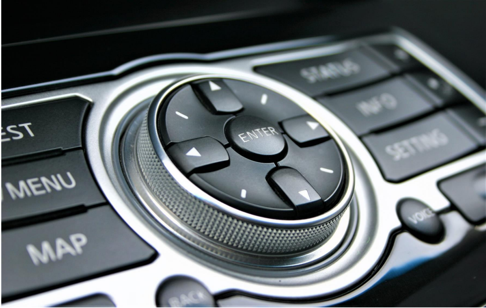
図1 めっき部品適用例